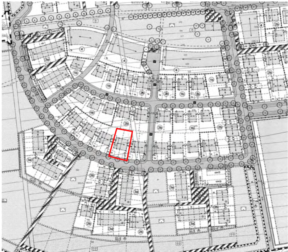
Abbildung: Ausschnitt aus dem rechtsgültigen Bebauungsplan "Wohngebiet Südwest" (Bplan 102) mit Eintragung des Plangebiets

Das Plangebiet besteht aus einem Grundstück, ist rund 0,1 Hektar groß und liegt im südlichen Bereich des Neubaugebiets „Wohngebiet Südwest“. Dieser Bereich des Wohngebiets befindet sich derzeit in der Entwicklung, das Grundstück im Plangebiet ist bereits bebaut.